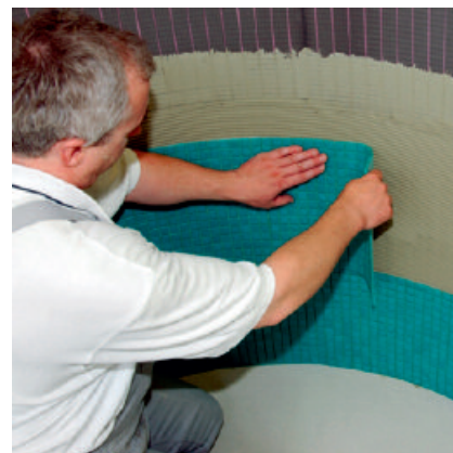
Ronde en gebogen ondergrondconstructies, met PCI PECIDUR CREATIV platen zijn er vele mogelijkheden

2.3 Na verharding van de mortel de ankerboren (8 mm en voldoende indringdiepte in de ondergrond \geq 50 mm ) en met PCI Pécidur Metalldübel verankeren.