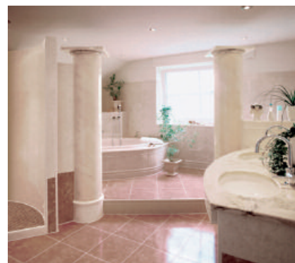
PCI Pécidur hardschuimplaten kunnen in vele vormen worden toegepast.