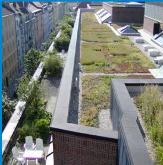
▲ Groendak Kulturzentrum Gasteig in München < Rijksmonument Pampus in Muiden