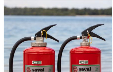
Saval Bioclass F3 duurzame schuimblusser