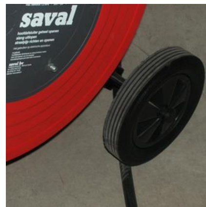
Probleemloos over obstakels