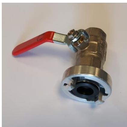
Storz aansluitset haspelwagen