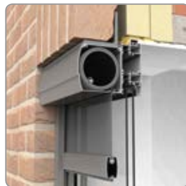
Doorsnede montagesituatie 1