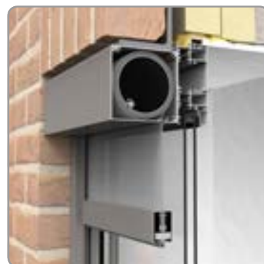
Doorsnede montagesituatie 1