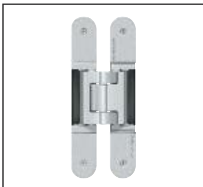
Binnenliggende onzichtbare scharnieren