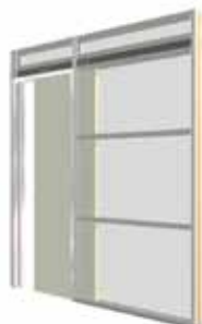
HD2 Standaard uitvoering