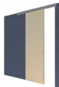
HD5 Deur voor de wand, verdiepingshoog