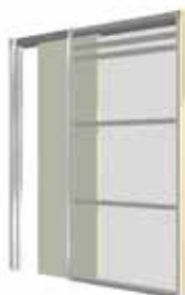
HD1 Deur verdiepingshoog