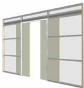
HD3 Dubbele deur