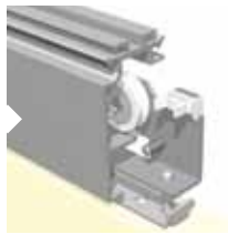
STALEN LOOPWAGENS MET GESLOTEN LAGERING