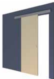
HD4 Deur voor de wand