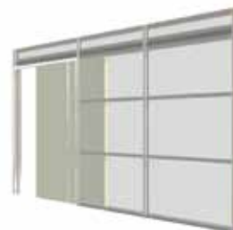
HD2 EXTREME Deur extra breed