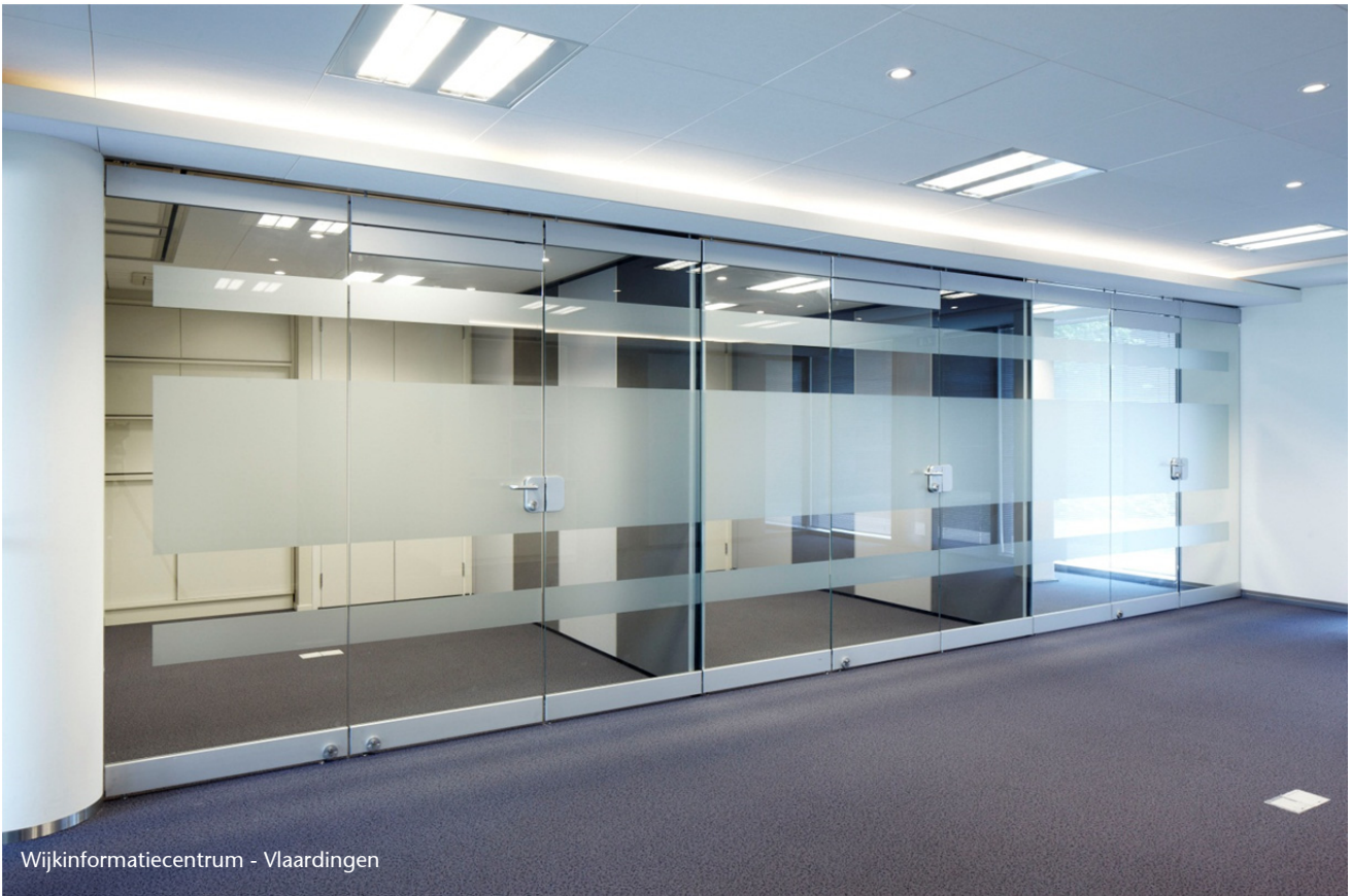
Wijkinformatiecentrum - Vlaardingen