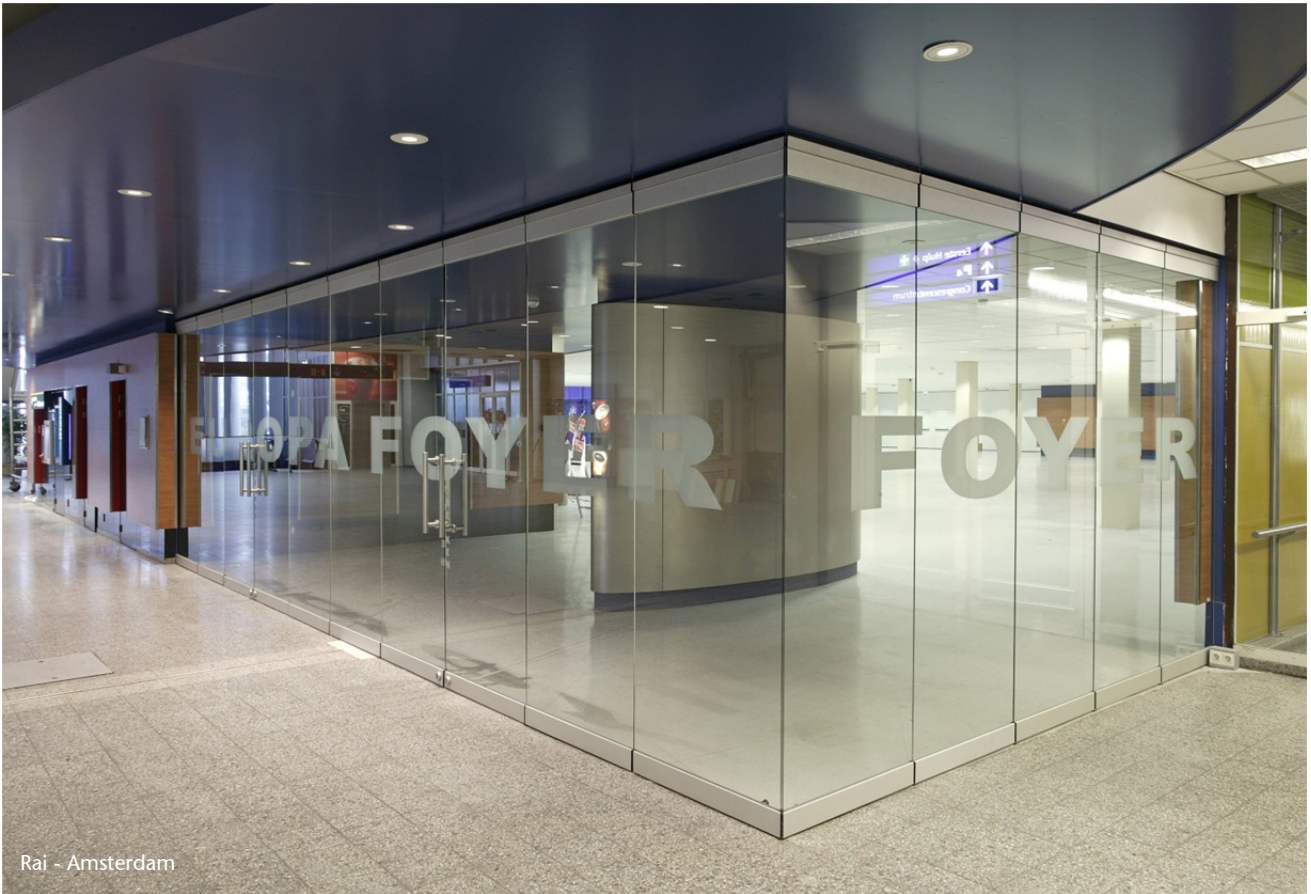
Rai - Amsterdam