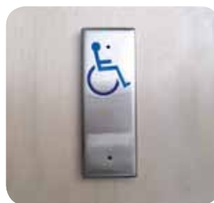
Drukknoppen met rolstoelembleem