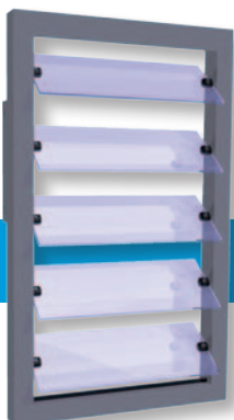
Enkel glas Middenscharnierend