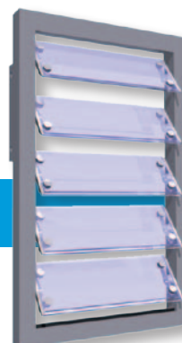
Enkel glas Puntgehouden