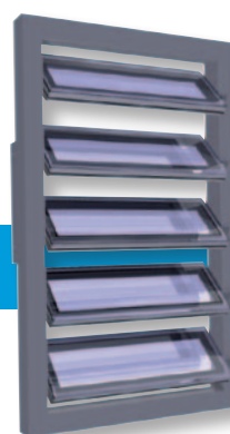
Dubbel glas Middenscharnierend