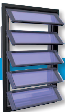
Dubbel glas Bovenscharnierend