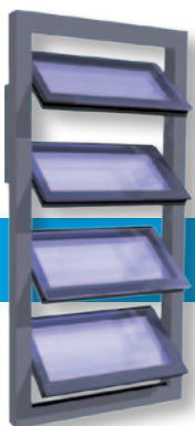
Dubbel glas Middenscharnierend gekaderd