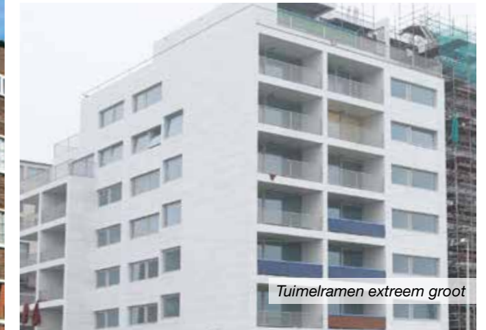
Tuimelramen extreem groot