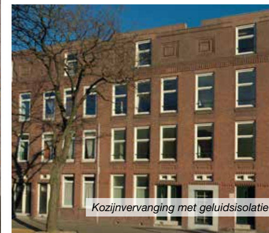
Kozijnvervangning met geluidsisolatie