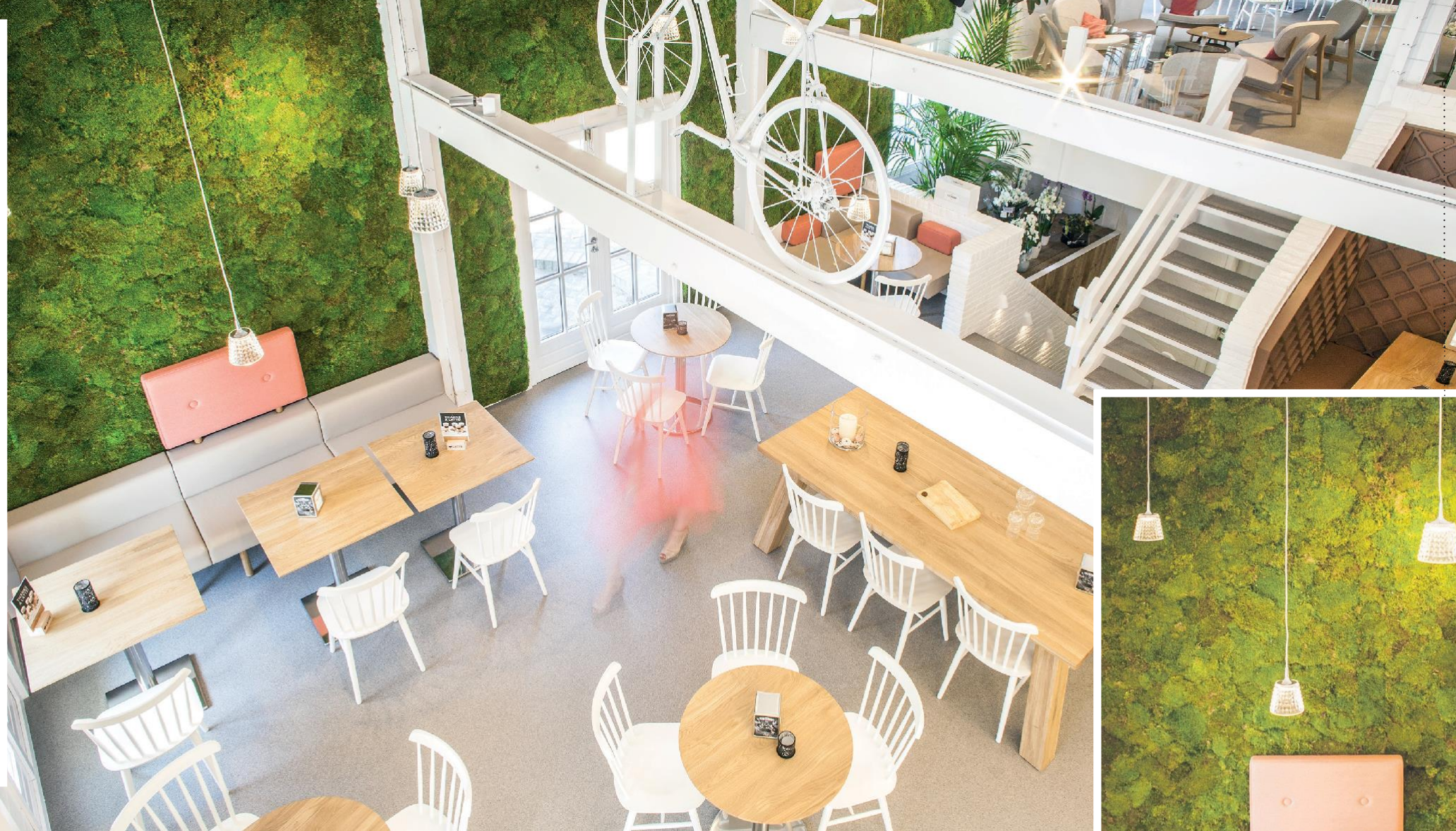
Designed by LOV Design – Anja Sanders